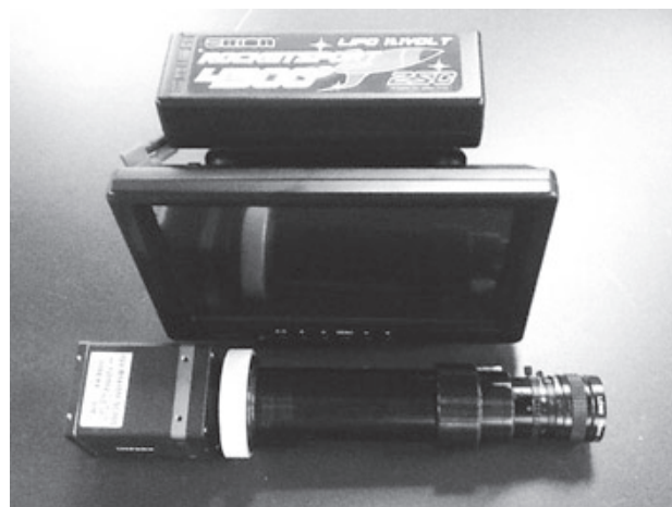
写真2 UAV (Unmanned aerial vehicle) 搭載型ハイパースペクトラルセンサ外観